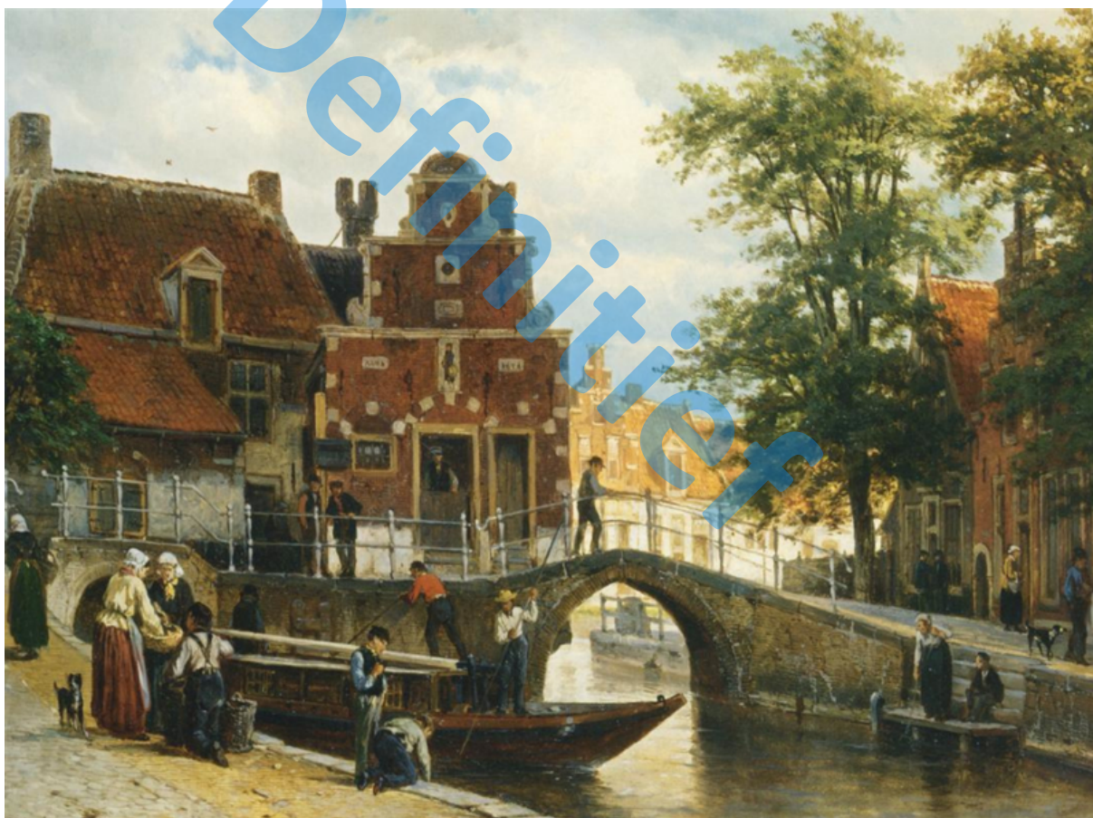
Een oude prent van het Korendragershuisje

De gegevens over de financiën van onze stichting zijn in dit verslag kort opgenomen. Het financieel overzicht staat uitgebreid in de jaarrekening, de door de accountant opgemaakte rekening en verantwoording over 2023.