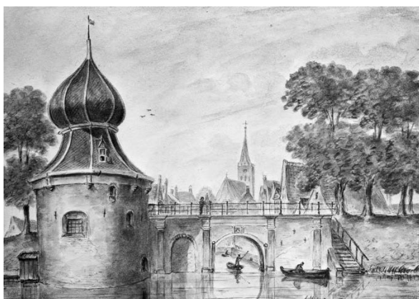
Blauwe toren met ooster pijp (ook wel Leeuwarderpoort genoemd)

Wij moeten met ons allen passen op ons cultureel erfgoed. Weg is weg en dat is niet wenselijk zoals onderstaande voorbeelden in Franeker aangeven.