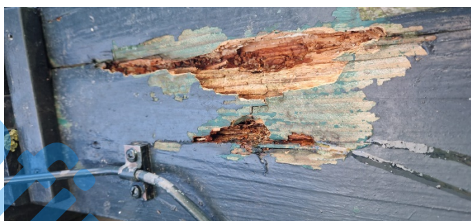
Molen Langwert met een zwaar aangetaste binnenroede