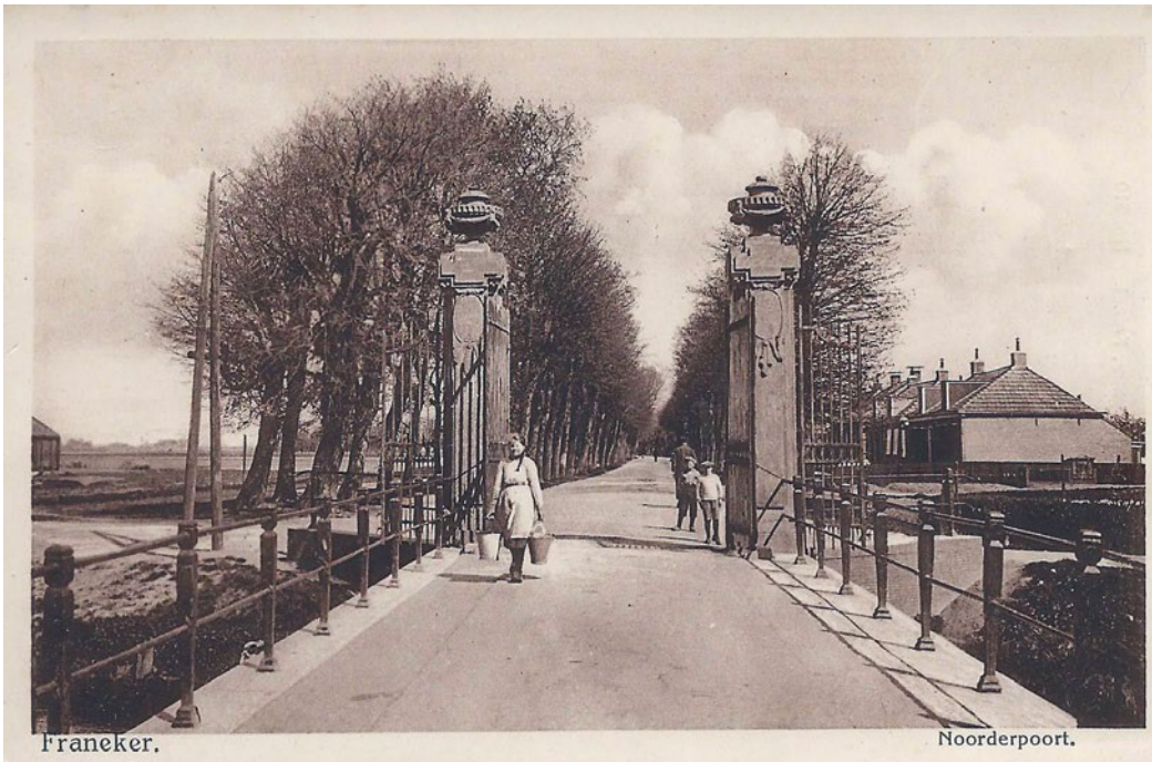
De Noorderpoort rond 1900 met de natuursteen pijlers en hekwerken op de gemetselde boogbrug. Op de achtergrond de Hertog van Saxenlaan.

Het zal weinigen opvallen, maar toch is er iets veranderd aan de monumentale poort bij de toegang naar het Westerbolwerk. De Stichting tot Behoud van Monumenten in Franekeradeel heeft haar naam eer aangedaan en een restauratie uitgevoerd die een compliment verdient.