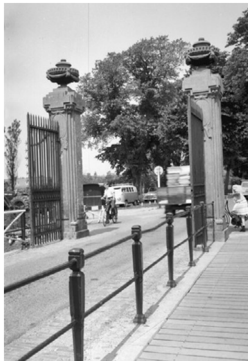
Een winst van 25 cm! De hekwerken zijn verplaatst naar de kopse kant van de natuurstenen pijlers, juist daar waar de ornamenten zitten.

ook in 2014 het initiatief de poort te herstellen. Kunst- en Siersmederij Rosier uit Akkrum restaureert de hekwerken, waarbij men de ontbrekende stalen spijlen speciaal uit Engeland laat komen omdat die afmetingen in Nederland niet te vinden zijn.