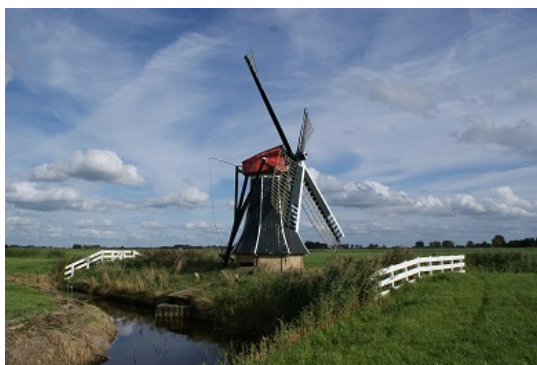
molen Langwert bij Winsum