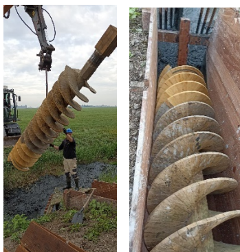
Tijdens de restauratie