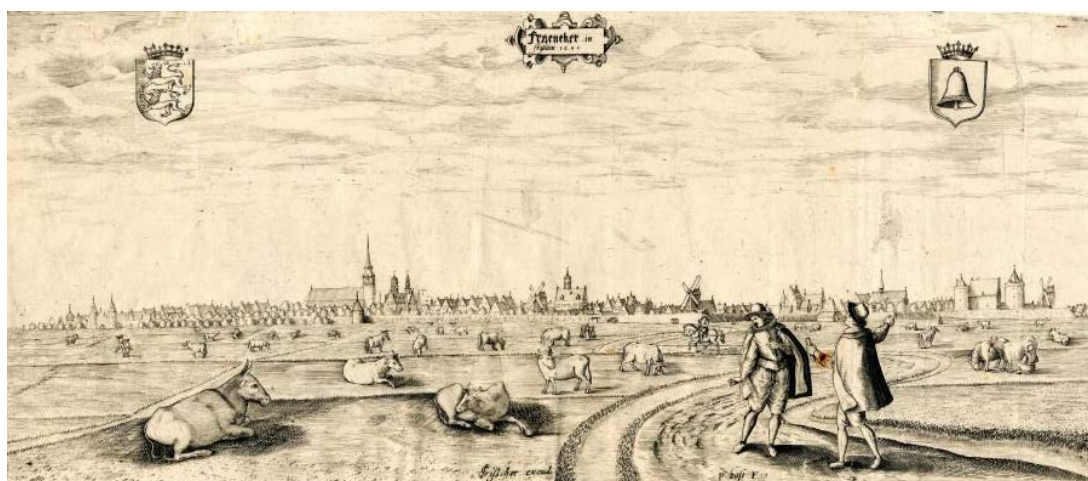
Een oude prent door Pieter Bast van Franeker met de Martinatoren prominent aangegeven

De gegevens over de financiën van onze stichting zijn in dit verslag kort opgenomen. Het financieel overzicht staat uitgebreid in de jaarrekening, de door de accountant opgemaakte rekening en verantwoording over 2022.