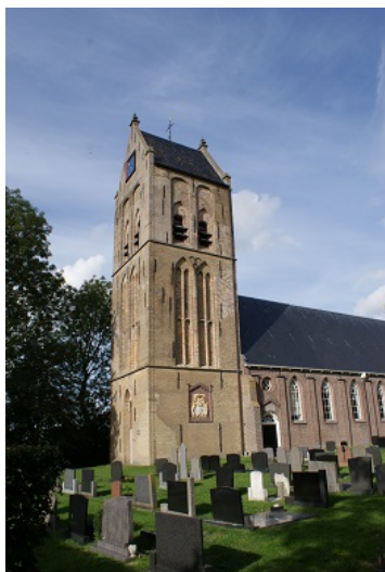
de kerktoren te Spannum

Voor deze monumenten zijn de bestaande beschikkingen voor instandhouding overgeschreven naar onze stichting en de monumenten zijn voor brand en storm verzekert bij Donatus.