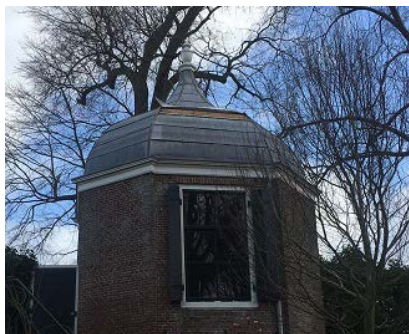
Schade dak theekoepel

opgewaaide loden dak van de theekoepel is door een zinkwerker hersteld. De herstelkosten bedroegen ca. € 5.000,--. Met Donatus verzekeringen zijn deze schades inmiddels afgedaan.