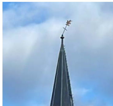
het krom gewaaide torenkruis